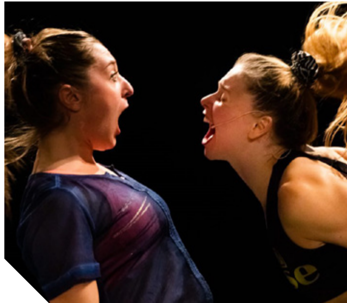
ChitChat – Co-productie van Maas theater en dans en Tuning People

Tijdens de voorstelling zien we een dansduet van twee meisjes die giebelen, schaterlachen, proesten, spelen, kletsen, stoeien en dansen. Alles samen en dan weer uit elkaar. Ze maken een wervelende dansvoorstelling met zelf-gemaakte klanken, gekoppeld aan bewegingen die variëren van zacht tot heel hard. Fleur vindt het maar raar en zo anders dan ze gewend is. Soumara vertelt dat ze zichzelf en haar zusje er wel in herkent."